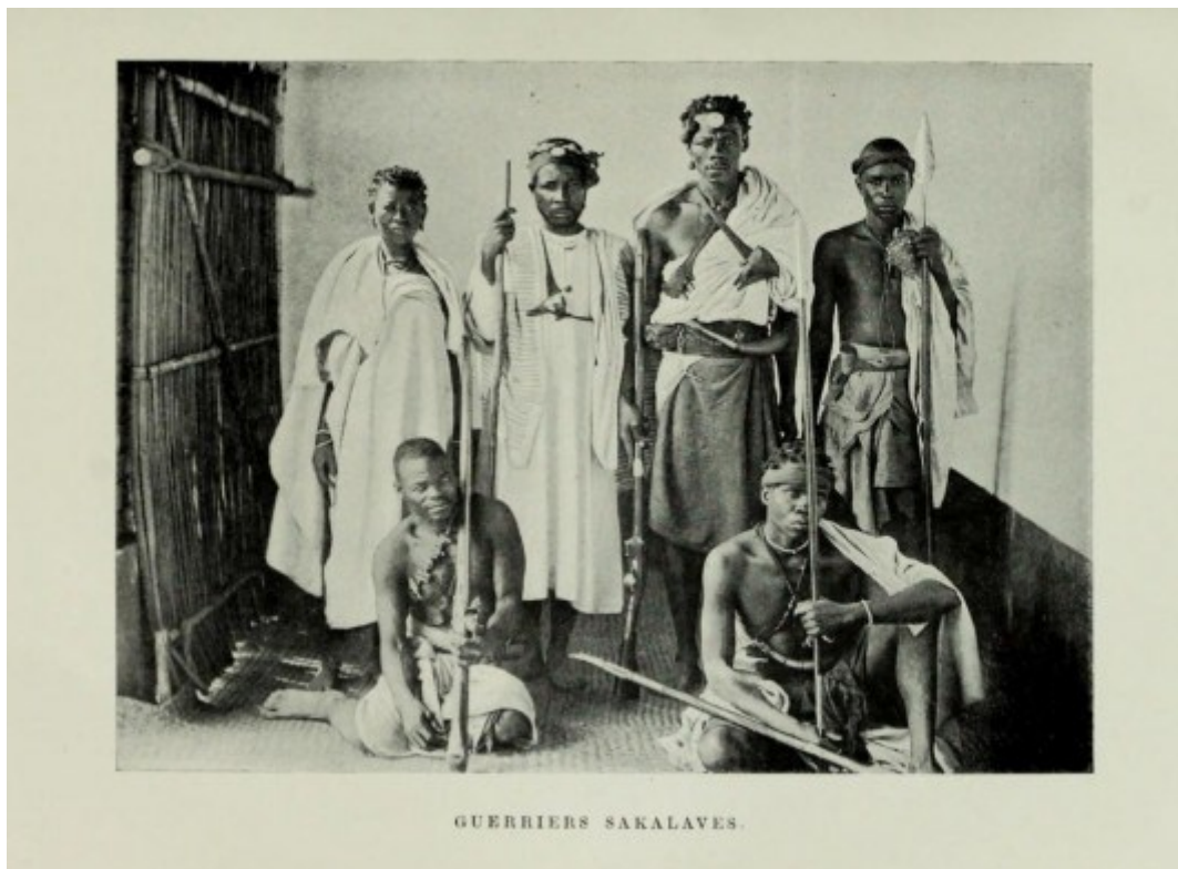
Image extraite de l'ouvrage du Général Gallieni, La pacification de Madagascar (opérations d'octobre 1896 à mars 1899), Paris, Chapelot, 1900.

L'écart énorme entre les chiffres avancés par Paul Vigné d'Octon et ceux annoncés dans le rapport ne sont pas sans rappeler, toutes proportions gardées, celui des différentes estimations autour de l'insurrection de mars 1947. On peut avancer cependant que les chiffres du rapport officiel sont très sousestimés: en effet, une peur panique s'empare des populations sakalavas juste après le massacre, suivie d'une insurrection générale commandée par Ingereza -frère et successeur de Toera- qui concerne tout le Menabe et dure jusqu'en 1902.